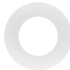
Collerette PD9 Ø 36 mm Ref.: 92238

Dimensions: Ø 36 mm Boîtier: Polycarbonate, UV-résistant Couleur du matériau: anthracite brillant