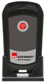
Adaptateur BLE-IR Ref.: 93067

Dimensions: Ø 36 mm Boîtier: Polycarbonate, UV-résistant Couleur du matériau: argent brillant