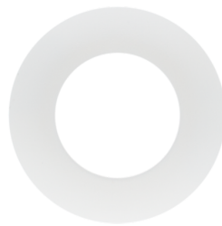
Collerette PD9 Ø 36 mm Ref.: 92238

Dimensions: Ø 36 mm Boîtier: Polycarbonate, UV-résistant Couleur du matériau: anthracite brillant