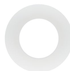
Collerette PD9 Ø 36 mm Ref.: 92238

Dimensions: Ø 36 mm Boîtier: Polycarbonate, UV-résistant Couleur du matériau: anthracite brillant