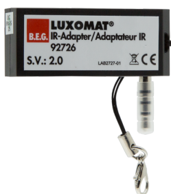
Adaptateur IR pour Smartphones Ref.: 92726

Dimensions: 40 x 55 x 103 mm Couleur du matériau: noir Fréquence: 2.4 GHz ISM-Band, GFSK 0.2 dBm + 5.3 dBi = 5.5 dBm