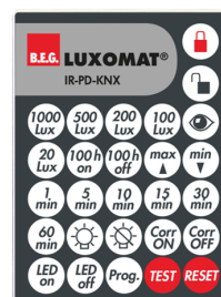
IR-PD-KNX Ref.: 92123

Dimensions: 47 x 19 x 10 mm Niveau de protection: IP20 Température ambiante: -20 °C à +40 °C