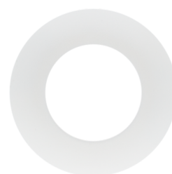
Collerette PD9 Ø 36 mm Ref.: 92238

Dimensions: Ø 36 mm Boîtier: Polycarbonate, UV-résistant Couleur du matériau: anthracite brillant