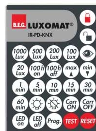
IR-PD-KNX Ref.: 92123

Dimensions: 47 x 19 x 10 mm Niveau de protection: IP20 Température ambiante: -20 °C à +40 °C