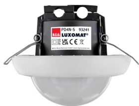
PD4N-S Ref.: 93241

Pour obtenir le bundle conformément à la spécification technique, veuillez commander les articles mentionnés.