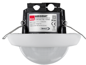
PD4N-M-DACO DALI-2 Ref.: 93460

Pour obtenir le bundle conformément à la spécification technique, veuillez commander les articles mentionnés.