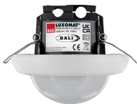
PD4N-M-DACO-1C DALI-2 Ref.: 93463

Pour obtenir le bundle conformément à la spécification technique, veuillez commander les articles mentionnés.