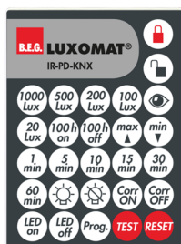
IR-PD-KNX Ref.: 92123

Dimensions: 40 x 55 x 103 mm Couleur du matériau: noir Fréquence: 2.4 GHz ISM-Band, GFSK 0.2 dBm + 5.3 dBi = 5.5 dBm