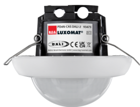
PD4N-CAS DALI-2 Ref.: 93473

Pour obtenir le bundle conformément à la spécification technique, veuillez commander les articles mentionnés.