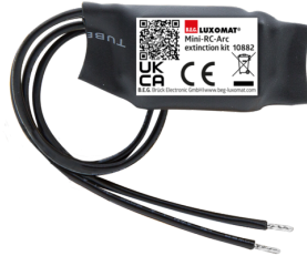
Mini-Kit Anti-arc Ref.: 10882

Tension: 230 V AC \pm 10\% Dimensions: 38 x 12 x 26 mm Niveau de protection: IP20 / Classe II