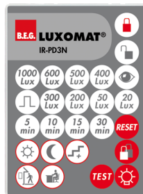
IR-PD3N Ref.: 92105

Dimensions: 47 x 19 x 10 mm Niveau de protection: IP20 Température ambiante: -20 °C à +40 °C