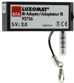
Adaptateur IR pour Smartphones Ref.: 92726

Dimensions: 40 x 55 x 103 mm Couleur du matériau: noir Fréquence: 2.4 GHz ISM-Band, GFSK 0.2 dBm + 5.3 dBi = 5.5 dBm