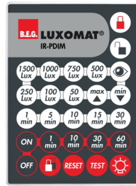
IR-PDim Ref.: 92200

Dimensions: Ø 200 x 90 mm Résistance aux chocs: IK09 Boîtier: panier en acier revêtu