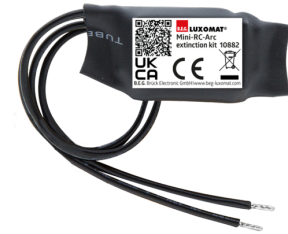
Mini-Kit Anti-arc Ref.: 10882

Tension: 230 V AC ±10% Dimensions: 38 x 12 x 26 mm Niveau de protection: IP20 / Classe II