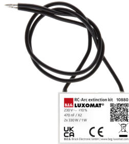
Kit Anti-arc Ref.: 10880

Batterie: 3.0 V Lithium CR2032 (compris dans la livraison) Dimensions: 57 x 35 x 7 mm Couleur du matériau: -