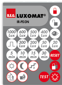
IR-PD3N Ref.: 92105

Batterie: 3.0 V Lithium CR2032 (compris dans la livraison) Dimensions: 80 x 60 x 8 mm Couleur du matériau: -