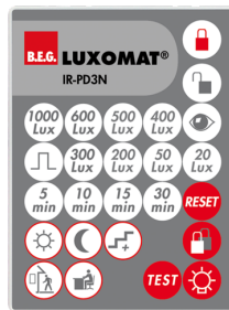
IR-PD3N Ref.: 92105

Batterie: 3.0 V Lithium CR2032 (compris dans la livraison) Dimensions: 80 x 60 x 8 mm Couleur du matériau: -