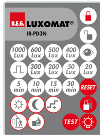
IR-PD3N Ref.: 92105

Batterie: 3.0 V Lithium CR2032 (compris dans la livraison) Dimensions: 80 x 60 x 8 mm Couleur du matériau: -