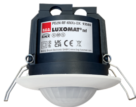
PD2N-RF-KNXs-DX-FP Ref.: 93580

Pour obtenir le bundle conformément à la spécification technique, veuillez commander les articles mentionnés.