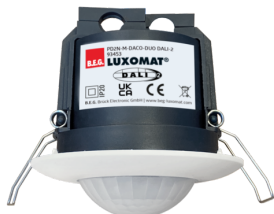
PD2N-M-DACO-DUO DALI-2 Ref.: 93453

Pour obtenir le bundle conformément à la spécification technique, veuillez commander les articles mentionnés.