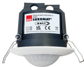
PD2N-M-DACO-DUO DALI-2 Ref.: 93453

Pour obtenir le bundle conformément à la spécification technique, veuillez commander les articles mentionnés.