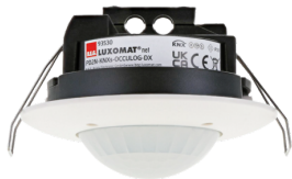
PD2N-KNXs-OCCULOG-DX-FP Ref.: 93530

Pour obtenir le bundle conformément à la spécification technique, veuillez commander les articles mentionnés.