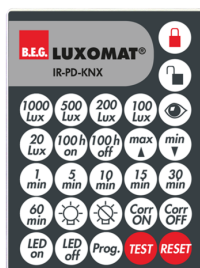
IR-PD-KNX Ref.: 92123

Dimensions: Ø 200 x 90 mm Résistance aux chocs: IK09 Boîtier: panier en acier revêtu