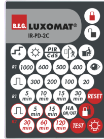
IR-PD-2C Ref.: 92475

Boîtier: Polycarbonate, UV-résistant Couleur du matériau: transparent