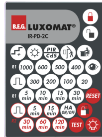
IR-PD-2C Ref.: 92475

Boîtier: Polycarbonate, UV-résistant Couleur du matériau: transparent