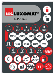
IR-PD-1C-E Ref.: 92077

Batterie: 3.0 V Lithium CR2032 (compris dans la livraison) Dimensions: 80 x 60 x 8 mm Couleur du matériau: -