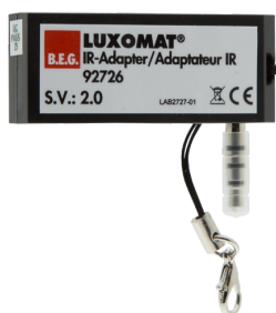
Adaptateur IR pour Smartphones Ref.: 92726

Dimensions: 54 x 54 x 2.6 mm Boîtier: Polycarbonate, UV-résistant Couleur du matériau: blanc mat, similaire RAL9010