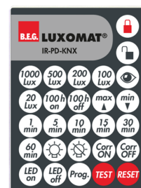
IR-PD-KNX Ref.: 92123

Niveau de protection: IP54 Boîtier: Polycarbonate, UV-résistant Couleur du matériau: blanc