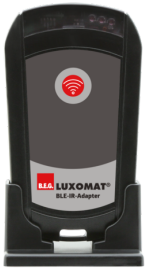
Adaptateur BLE-IR Ref.: 93067

Dimensions: 40 x 55 x 103 mm Couleur du matériau: noir Fréquence: 2.4 GHz ISM-Band, GFSK 0.2 dBm + 5.3 dBi = 5.5 dBm