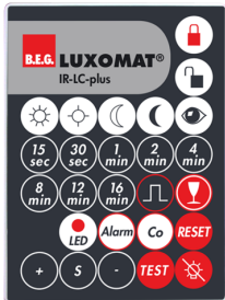
IR-LC-plus Ref.: 92095

Dimensions: 40 x 55 x 103 mm Couleur du matériau: noir Fréquence: 2.4 GHz ISM-Band, GFSK 0.2 dBm + 5.3 dBi = 5.5 dBm