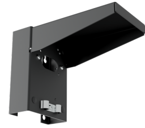
Support mural avec protection contre les intempéries Ref.: 93221

Dimensions: 188 x 98 x 134 mm Couleur du matériau: blanc