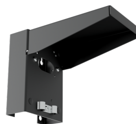
Support mural avec protection contre les intempéries Ref.: 93221

Dimensions: 188 x 98 x 134 mm Couleur du matériau: blanc