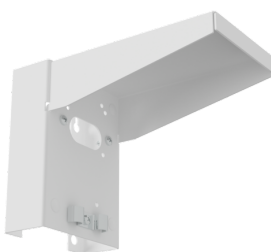
Support mural avec protection contre les intempéries Ref.: 93222

Dimensions: 188 x 98 x 134 mm Boîtier: acier inoxydable Couleur du matériau: acier inoxydable