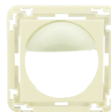
Plaque centrale Indoor 180 45x45 Ref.: 39076

Dimensions: 45 x 45 mm Couleur du matériau: blanc laque mat, similaire RAL9016