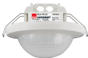
BL4-PLUS-FP Ref.: 93404

Pour obtenir le bundle conformément à la spécification technique, veuillez commander les articles mentionnés.