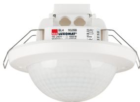
BL4-FP Ref.: 93288

Pour obtenir le bundle conformément à la spécification technique, veuillez commander les articles mentionnés.