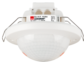
BL4-C-FP Ref.: 93284

Pour obtenir le bundle conformément à la spécification technique, veuillez commander les articles mentionnés.