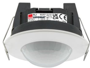
BL2-FP Ref.: 93317

Pour obtenir le bundle conformément à la spécification technique, veuillez commander les articles mentionnés.