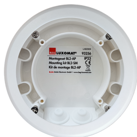
Kit de montage BL2-AP Ref.: 93256

Tension: 110 - 240 V Dimensions: Ø 80 x 61 mm Puissance interne: 0.3 W