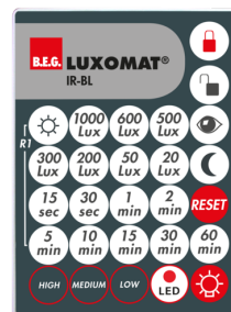
IR-BL Ref.: 93055

Tension: 230 V AC \pm 10\% Dimensions: 50 x 23 x 8 mm Niveau de protection: IP20 / Classe II