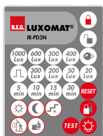
IR-PD3N Número: 92105

Dimensões: 40 x 55 x 103 mm Cor do material: Preto Frequência: 2.4 GHz Banda ISM , GFSK 0.2 dBm + 5.3 dBi = 5.5 dBm