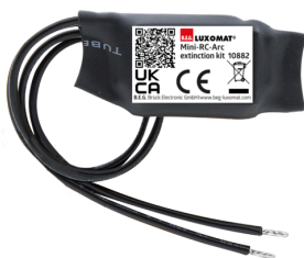
Mini kit RC supressor de arco elétrico Número: 10882

Tensão: 230 V AC \pm 10\% Dimensões: 38 x 12 x 26 mm Grau de proteção / Classe de Isolamento: IP20 / Classe II