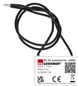
Kit RC supressor de arco elétrico Número: 10880

Tensão: 230 V AC \pm 10\% Dimensões: 38 x 12 x 26 mm Grau de proteção / Classe de Isolamento: IP20 / Classe II