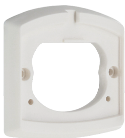
Moldura LC Número: 91080

Dimensões: 188 x 98 x 134 mm Cor do material: antracite