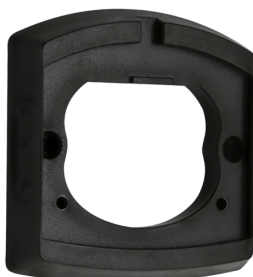
Moldura LC Número: 91081

Dimensões: 78 x 78 x 13 mm Involucro: Policarbonato resistente aos raios UV Cor do material: Branco