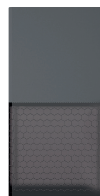
93134 Cinza antracite