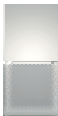
93132 Branco puro