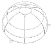
Beschermingskorf BSK (Ø 200 x 90 mm) Art.nr.: 92199

Afmetingen: 80 x 60 x 8 mm Kleur: - Accu: Lithium 3.0 V<BR>0 mAh