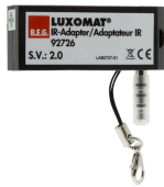
IR-Adapter voor Smartphones Art.nr.: 92726

Afmetingen: 40 x 55 x 103 mm Kleur: zwart Frequentie: 2.4 GHz ISM band, GFSK 0.2 dBm + 5.3 dBi = 5.5 dBm