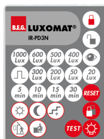
IR-PD3N Numero: 92105

Dimensioni: 47 x 19 x 10 mm Classe / Grado protezione: IP20 Temperatura funzionamento: -20 °C a +40 °C