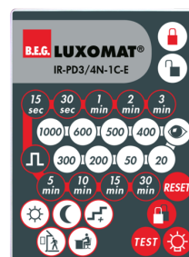
IR-PD3/4N-1C-E Numero: 93110

Batteria: 3.0 V Litio CR2032 (incluso) Dimensioni: 80 x 60 x 8 mm Colore di materiale: -