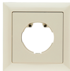
Cadre IP20 Indoor 140-L

Dimensions: 88 x 88 mm, Dimension interne 63 x 63 mm Niveau de protection: IP20 / Classe II Couleur du matériau: blanc pur mat, similaire RAL9010