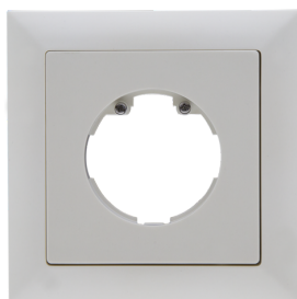
Cadre IP20 Indoor 140-L

Dimensions: 88 x 88 mm, Dimension interne 63 x 63 mm Niveau de protection: IP20 / Classe II Couleur du matériau: blanc perlé mat, similaire RAL1013