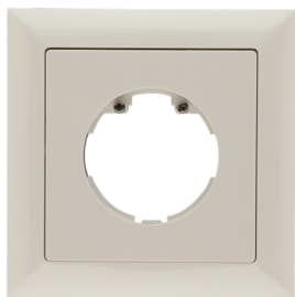
Cadre IP20 Indoor 140-L