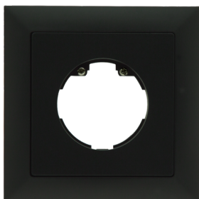
Cadre IP20 Indoor 140-L

Dimensions: 88 x 88 mm, Dimension interne 63 x 63 mm Niveau de protection: IP20 / Classe II Couleur du matériau: blanc pur brillant, similaire RAL9010