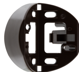
Socle d'angle RC-plus next Ref.: 97014

Dimensions: Ø 71 x 34 mm Niveau de protection: IP54 Boîtier: Polycarbonate, UV-résistant