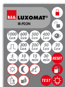
IR-PD3N Ref.: 92105

Dimensions: 47 x 19 x 10 mm Niveau de protection: IP20 Température ambiante: -20 °C à +40 °C