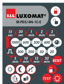
IR-PD3/4N-1C-E Ref.: 93110

Dimensions: 40 x 55 x 103 mm Couleur du matériau: noir Fréquence: 2.4 GHz ISM-Band, GFSK 0.2 dBm + 5.3 dBi = 5.5 dBm