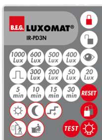
IR-PD3N Ref.: 92105

Batterie: 3.0 V Lithium CR2032 (compris dans la livraison) Dimensions: 80 x 60 x 8 mm Couleur du matériau: -