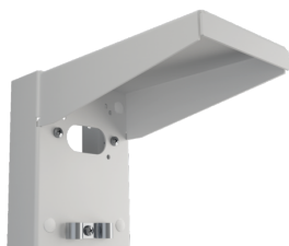
Support mural avec protection contre les intempéries Ref.: 93222

Dimensions: 188 x 98 x 134 mm Boîtier: acier inoxydable Couleur du matériau: acier inoxydable