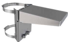
fixation au poteaux avec protection contre les intempéries Ref.: 93220

Dimensions: Ø 164 x 143 mm Résistance aux chocs: IK09 Boîtier: panier en acier revêtu