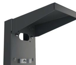
Support mural avec protection contre les intempéries Ref.: 93221

Dimensions: 188 x 98 x 134 mm Couleur du matériau: blanc