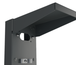
Support mural avec protection contre les intempéries Ref.: 93221

Dimensions: 188 x 98 x 134 mm Couleur du matériau: blanc