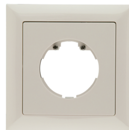
Cadre IP20 Indoor 140-L Ref.: 94344

Tension: 230 V AC \pm 10\% Dimensions: 50 x 23 x 8 mm Niveau de protection: IP20 / Classe II