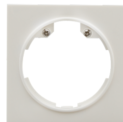
Plaque centrale Indoor 140 55x55 Ref.: 94346

Dimensions: 45 x 45 mm Niveau de protection: IP20 / Classe II Couleur du matériau: blanc perlé mat, similaire RAL1013