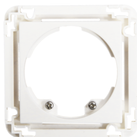
Plaque centrale Indoor 140 45x45 Ref.: 39075

Dimensions: 45 x 45 mm Niveau de protection: IP20 / Classe II Couleur du matériau: blanc pur brillant, similaire RAL9010