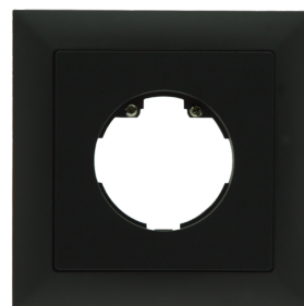
Cadre IP20 Indoor 140-L Ref.: 94341

Dimensions: 88 x 88 mm, Dimension interne 63 x 63 mm Niveau de protection: IP20 / Classe II Couleur du matériau: blanc pur brillant, similaire RAL9010