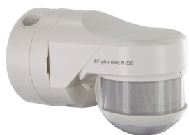
RC-plus next N 230 KNXs-DX Nº de artículo: 93527

Para recibir el paquete conforme a las especificaciones técnicas, pida los artículos indicados.