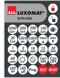
IR-PD-KNX Nº de artículo: 92123

Dimensiones: 47 x 19 x 10 mm Grado de protección / Clase: IP20 Temperatura ambiental: -20 °C a +40 °C