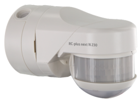
RC-plus next N 230 KNXs-DX 230 Nº de artículo: 93527

Para recibir el paquete conforme a las especificaciones técnicas, pida los artículos indicados.