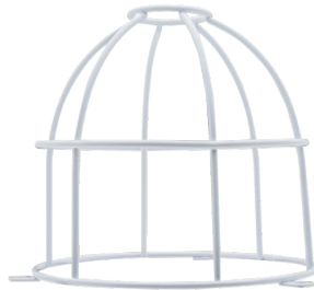
Rejilla de protección metálica BSK (Ø 164 x 143 mm) Nº de artículo: 92467

Batería: 3.0 V Litio CR2032 (incluida) Dimensiones: 57 x 35 x 7 mm Color de material: -