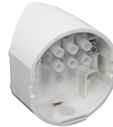
Zócalo angular interior RC-plus next Nº de artículo: 97005

Dimensiones: Ø 164 x 143 mm Resistencia a impactos: IK09 Carcasa: rejilla de acero texturizado