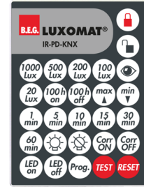
IR-PD-KNX Nº de artículo: 92123

Dimensiones: 47 x 19 x 10 mm Grado de protección / Clase: IP20 Temperatura ambiental: -20 °C a +40 °C