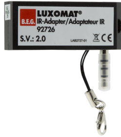
Adaptador IR para smartphones Nº de artículo: 92726

Dimensiones: 40 x 55 x 103 mm Color de material: negro Frecuencia: 2.4 GHz Banda ISM, GFSK 0.2 dBm + 5.3 dBi = 5.5 dBm